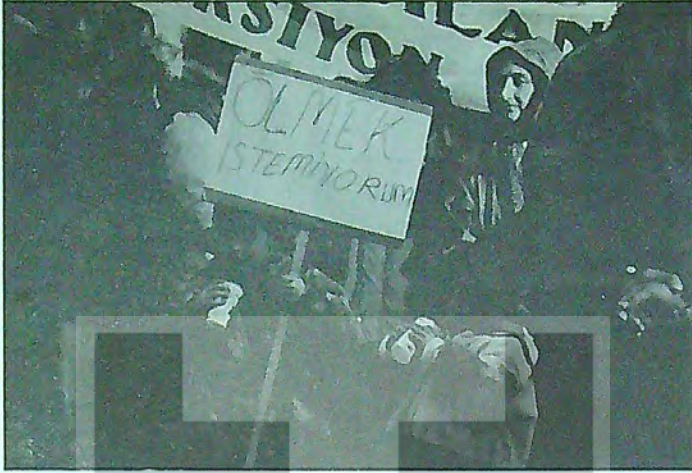
16 Ocak 1993 İstanbul Gaziosmanpaşa Meydanı. İHD'nin düzenlediği "Radyasyonu Gizleyenler Yargılansın" Mitingi.

askerlere de yedirildi. Herkese bile bile ölüm bulaşındı.